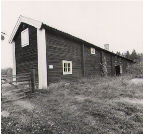
Södra delen av Långa längan.

Den bevarade östra längan (Långa längan) uppfördes troligen efter ryssarnas härjningar 1719. Längans södra del är den äldsta och uppförd i timmer. I denna del finns en kroglokal, en kammare åt krögaren och förr fanns även några rum för övernattande gäster. Den norra delen av längan är yngre och innehåller stall. Denna del är uppförd av stående brädor.