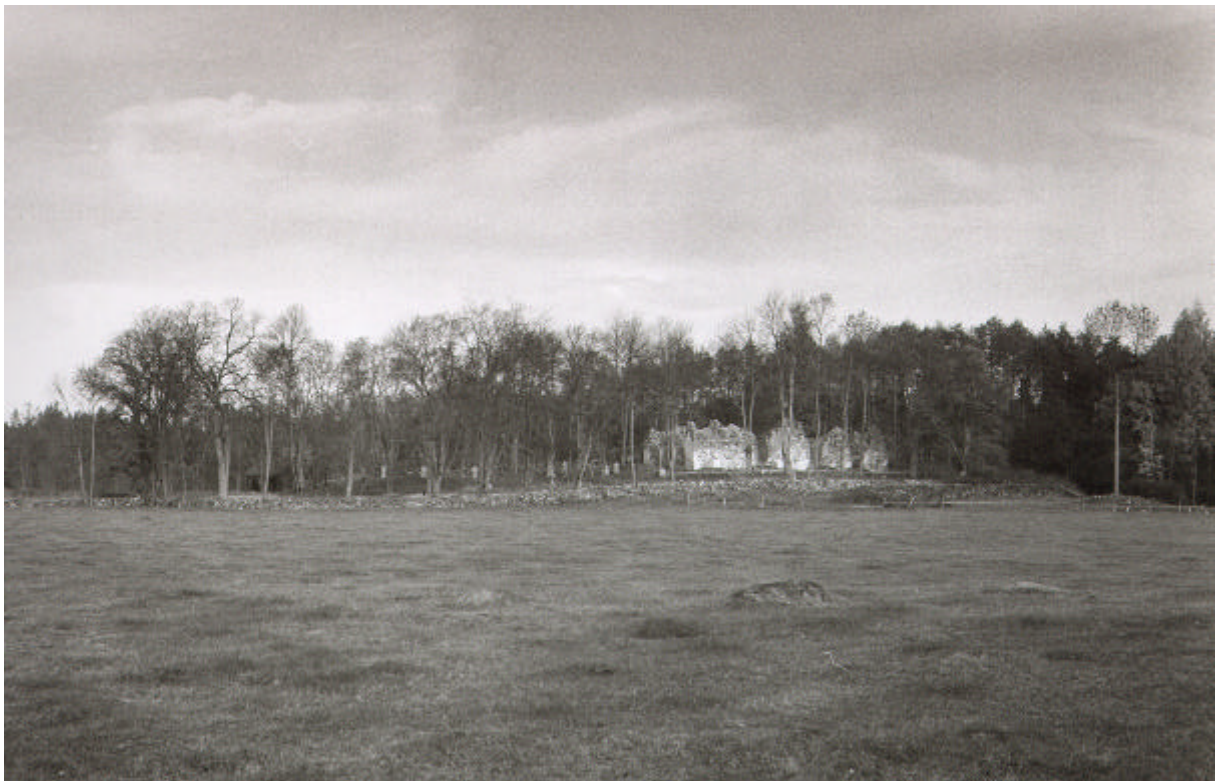
Ödekyrkogården som den såg ut före renoveringen 1972.

Det är en beskrivning som stämmer väl överens även med dagens förhållanden. Omgivet av skog ligger Krokek med sina öppna marker som en glänta i skogen.