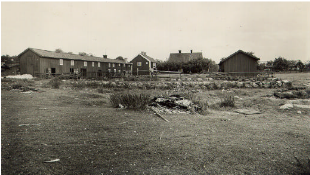
Gästgivaregården med Långa längan till vänster i bild. 1931.

Krokeks gästgivaregård omnämns första gången år 1649. Det sker i landshövding Skyttes förteckning över gästgiverier i Östergötland. Krokeks gästgivaregård var på sin tid ett av de största gästgiverierna på Östergötlands landsbygd. Gästgivaregården ödelades vid ryssarnas härjningar år 1719. Av de byggnader som sedan uppfördes är idag endast delar av den så kallade Långa längan bevarad.