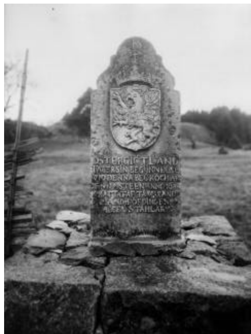
Gränssten vid länsgränsen mot Södermanland. Foto 1927. Östergötlands länsmuseum.

Då stambanan mellan Nyköping och Norrköping stod klar minskade resandet på gamla Stockholmsvägen. När så församlingens kyrka brann 1889, beslutades att den nya skulle uppföras i södra delen av socknen. Därmed förlorade Krokek sin betydelse som sockencentrum. Under andra hälften av 1800-talet och början av 1900-talet fungerade gästgiveriet som luffarhärbärke, innan det slutgiltigt lades ned 1933.