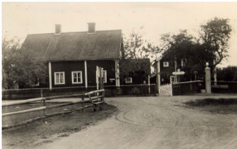
Krokeks gästgivaregård. Mangårdsbyggnaden med den numera nedbrunna östra flygeln. Foto B. Cnatingius, 1930. Östergötlands länsmuseum.

Fram till år 1949 hade mangården en flygelbyggnad åt öster, vilken brann ned detta år. Flygelns bottenvåning upptogs dels av bostad åt hållkarlen, som var förman för kuskarna och ansvarig för att skjutsarna gick ut i tid och dels några rum för resande. I övre våningen låg prästkammaren, som sannolikt endast användes tidvis.