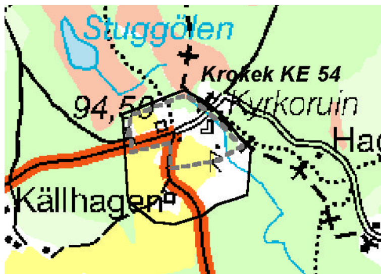
Helstreckad svart linje utgör den nya gränsen, streckad grå linje den äldre. Skala 1:10 000.

Riksintressets gränser föreslås i detta arbete utvidgas något för att innefatta en större del av det öppna landskap som utbreder sig söder om Krokeks gästgivargård och ödekyrkogård. På så vis innefattas också Krokeks gamla ålderdomshem i riksintresset (i dess södra del). Denna byggnad var ett viktigt inslag i det sockencentrum som Krokek en gång utgjorde.