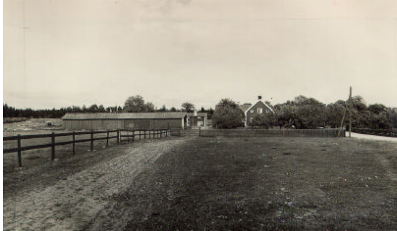
Gästgivargården med den numera rivna västra längan. Foto S Wallin, 1931. Östergötlands länsmuseum.

Mangårdsbyggnaden till Krokeks gästgivaregård är idag en faluröd, panelad byggnad från mitten av 1800-talet. Byggnaden har dock fått en förändrad karaktär vid en genomgripande renovering i början av 1950-talet, då bl a fönstren byttes mot moderna med hela rutor.