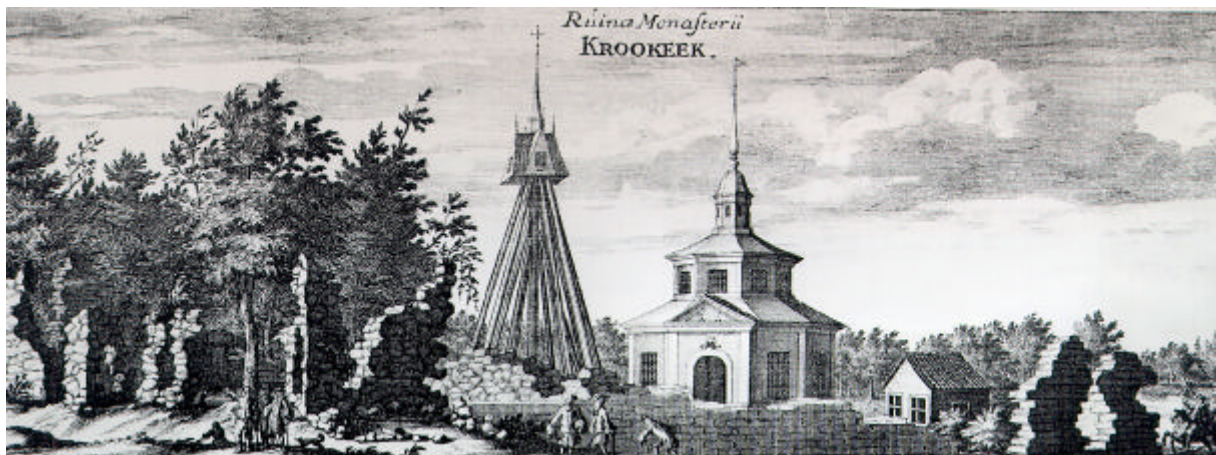
Gunillakyrkan avbildad i Eric Dahlbergs Suecia antiqua et hodierna, år 1675.

Drottning Gunilla lät pryda och förse sin kyrka med nödvändig kyrkoskrud och skänkte bl a en förgylld kalk. I Krokeks nuvarande kyrka förvaras ett konsthistoriskt intressant kalkkläde från 1500-talets slut eller 1600-talets början. Denna broderade duk bör ha tillhört de inventarier som prydde Gunillakyrkan.