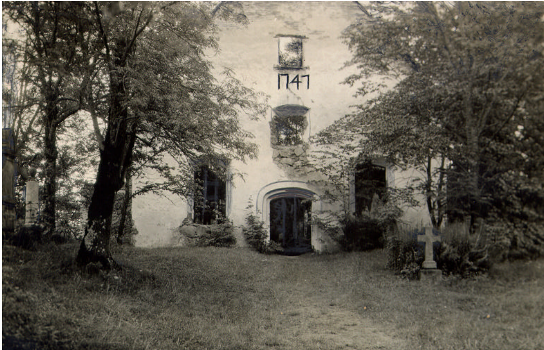
Ruinerna efter kung Fredriks kyrka, som den såg ut år 1930.