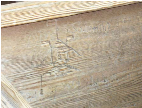
Klotter i korbänk

beskrivning gjord av Åke Nisbeth. En av valvpelarna i söder är skadad där den gamla predikstolen hade sin plats. Predikstolen finns numera i Finspångs slottskapell. I söder finns tre stora fönsteröppningar och två mindre, högt sittande. För beskrivning av utformningen se exteriör beskrivning. Sydportalen är en raksluten öppning som avskiljs från fönstret ovanför genom liggande brädor. Dörren är en raksluten järndörr rikt bemålad i rött, grönt, gult samt med förtennade detaljer. Korportalen är en bred stickbågig öppning med rundbågig plankdörr. Innanför dörren ligger en bom som är inskjuten i muren. I väster finns en bred, svagt välvd portal mot vapenhuset. I den djupa muren är portalen smalare, lägre och rundbågig längst i väster mot vapenhuset med en enkel plankdörr. Inne i långhuset finns en tegelimiterande målning över dörröppningen med senare färgskikt över. I dörrsmygen finns urtag för en bom. Den mycket ålderdomliga bänkinredningen är indelad i fyra kvarter. De främre kvarteren kan ha tillkommit i samband med att nya koret byggdes på 1600-talet, då bänkar sattes i det gamla koret. Den främre raden på var sida har front och dörrar av samma modell liksom snideriarbete på insidan av ryggstödet. Nio bänkar i södra främre kvarteret och 10 i det norra har en bänk vänd mot väster och en bänk vänd mot öster. Genomgången till nykyrkan sker