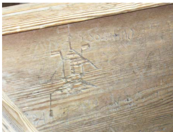
Klotter i korbänk

beskrivning gjord av Åke Nisbeth. En av valvpelarna i söder är skadad där den gamla predikstolen hade sin plats. Predikstolen finns numera i Finspångs slottskapell. I söder finns tre stora fönsteröppningar och två mindre, högt sittande. För beskrivning av utformningen se exteriör beskrivning. Sydportalen är en raksluten öppning som avskiljs från fönstret ovanför genom liggande brädor. Dörren är en raksluten järndörr rikt bemålad i rött, grönt, gult samt med förtennade detaljer. Korportalen är en bred stickbågig öppning med rundbågig plankdörr. Innanför dörren ligger en bom som är inskjuten i muren. I väster finns en bred, svagt välvd portal mot vapenhuset. I den djupa muren är portalen smalare, lägre och rundbågig längst i väster mot vapenhuset med en enkel plankdörr. Inne i långhuset finns en tegelimiterande målning över dörröppningen med senare färgskikt över. I dörrsmygen finns urtag för en bom. Den mycket ålderdomliga bänkinredningen är indelad i fyra kvarter. De främre kvarteren kan ha tillkommit i samband med att nya koret byggdes på 1600-talet, då bänkar sattes i det gamla koret. Den främre raden på var sida har front och dörrar av samma modell liksom sniderarbete på insidan av ryggstödet. Nio bänkar i södra främre kvarteret och 10 i det norra har en bänk vänd mot väster och en bänk vänd mot öster. Genomgången till nykyrkan sker